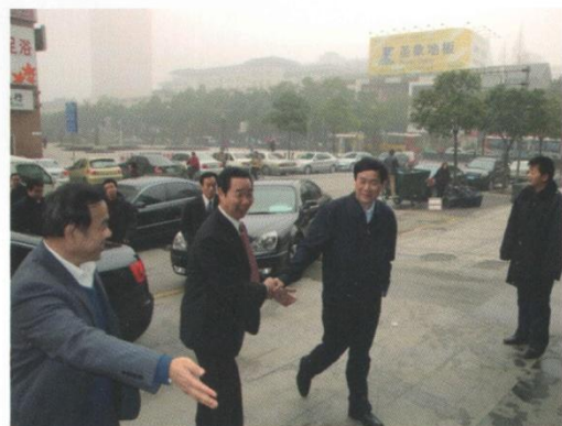
江苏省省长助理徐南平院士、江苏省知识产权局朱宇局长等领导视察经纬公司