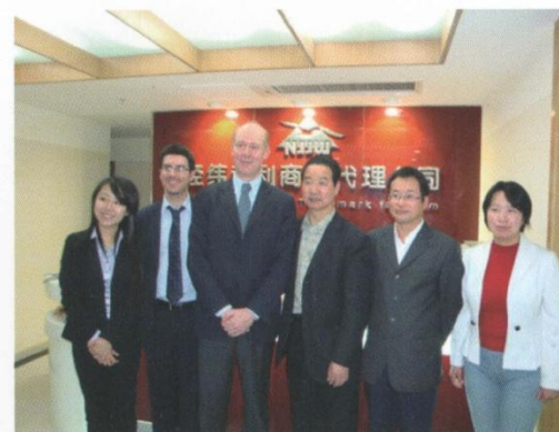
经纬公司广泛开展国际交流合作 图为欧洲专利律师协会主席PATRIC VIDON 一行访问经纬公司

公司以服务团队专业化、特色化、规模化、国际化的优势，以“第一时间”的品牌，为企业实施知识产权战略需要，提供四大类知识产权服务产品。